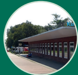
KuKuK e.V. Café & Bar \ Kunst und Kultur im Köpfchen \ Ehemaliges dt. Zollhaus