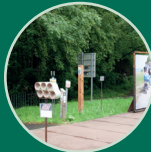
Einstieg der Route am Grenzpunkt Null