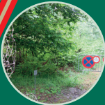
Für Radfahrer und Reiter gesperrte Teilstrecke